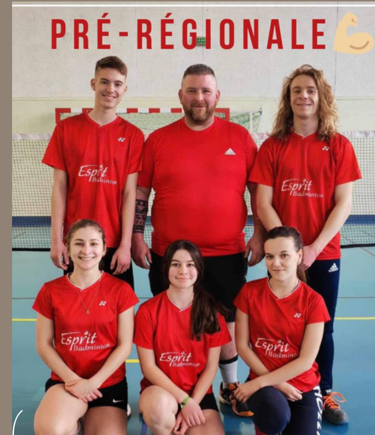
L'équipe 4 à Péronne