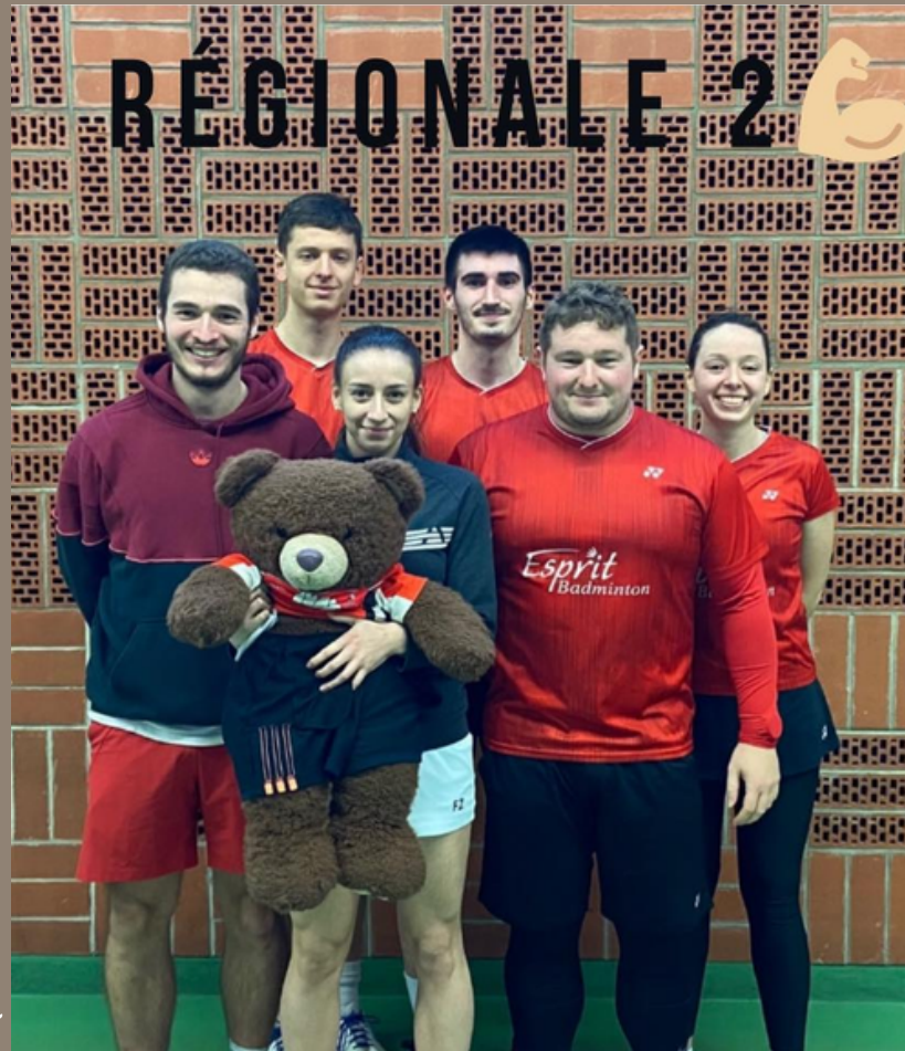
L'équipe 2 à Mons-en-Barœul