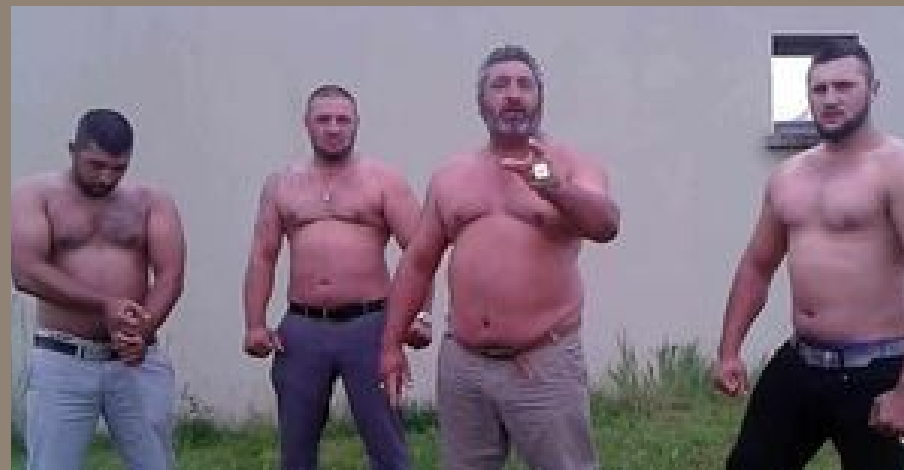
Merci Laurent pour cette photo ;)